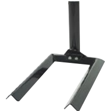
Pied Autocal Référence 0922 • En acier 35 € HT