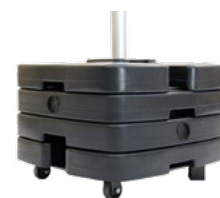
Platine Robusto® + 4 lests Référence 3667 • 50 x 50 cm - 110 kg 139 € HT Lest supplémentaire 25 kg Référence 3670 19 € HT