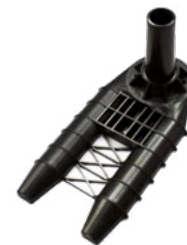
Pied Autocal XL Référence 4305 • Ø 45 mm • En résine, 60 cm de long • Pour véhicules lourds 45 € HT