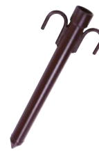
Fourreau Référence 0912 • 56 cm, 3kg 49 € HT